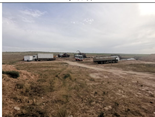
李 52x 井