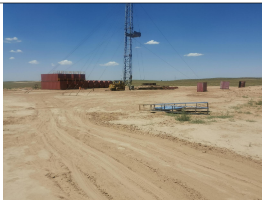
李 67 井