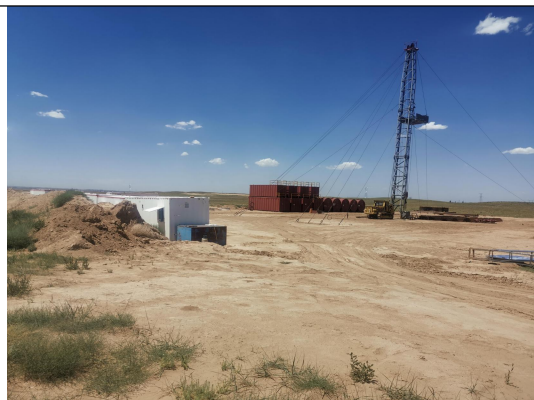
李 67 井