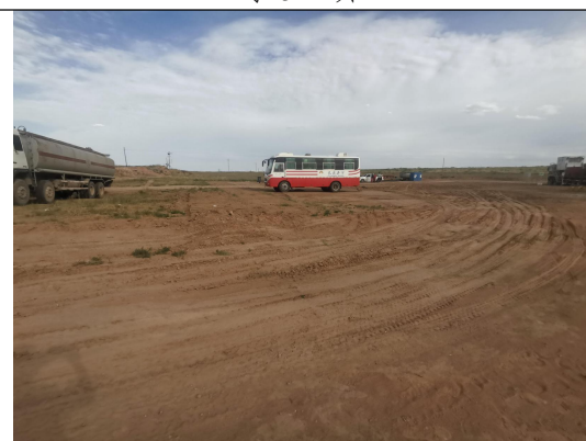
李 62 井