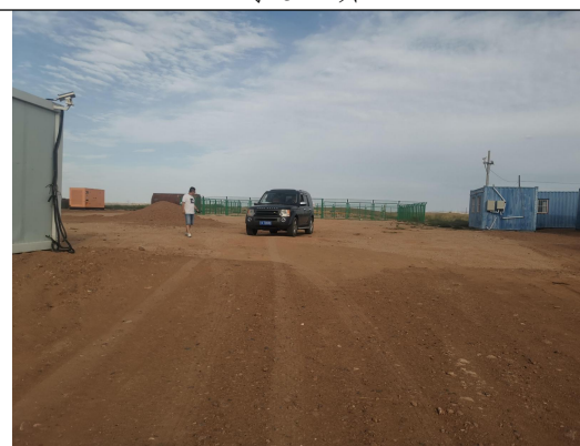
李 85 井