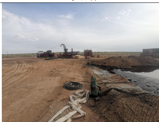
李 52x 井